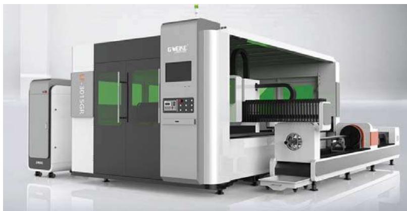
Vista spaccata – Split view

LF3015GR fiber laser cutting machine can not only cut metal plates, but also metal pipes. It has many uses and can save the space of more than 50%, which effectively improve productivity