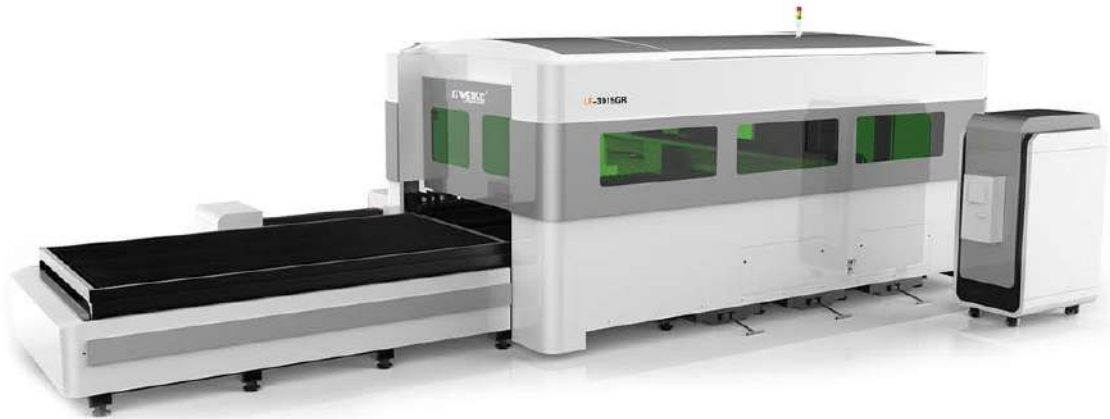
Vista spaccata – Split view