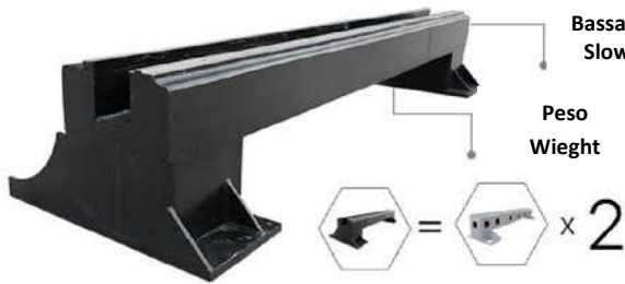
1° generazione con carro in acciaio 1st generation steel beam